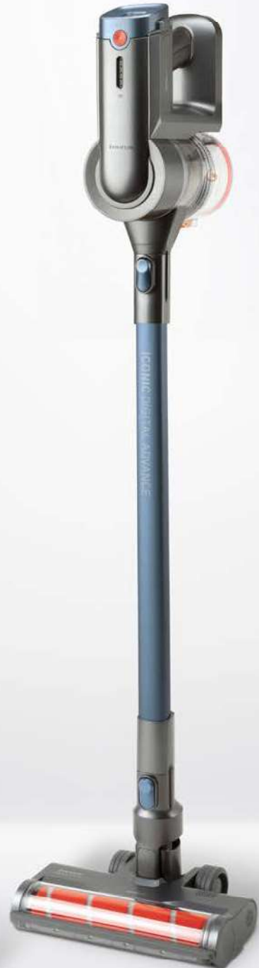
ICONIC DIGITAL ADVANCE 25.2V