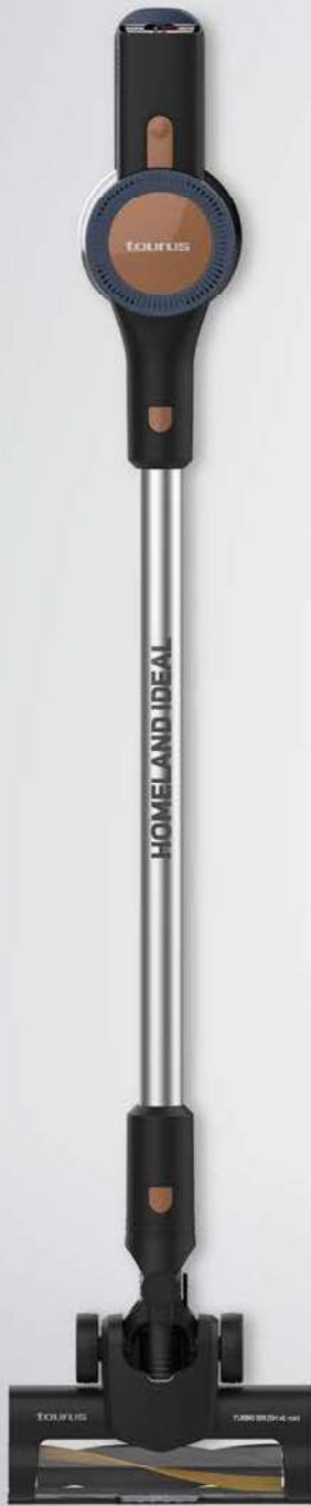
HOMELAND IDEAL 150W