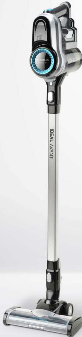
IDEAL AVANT 29.6V