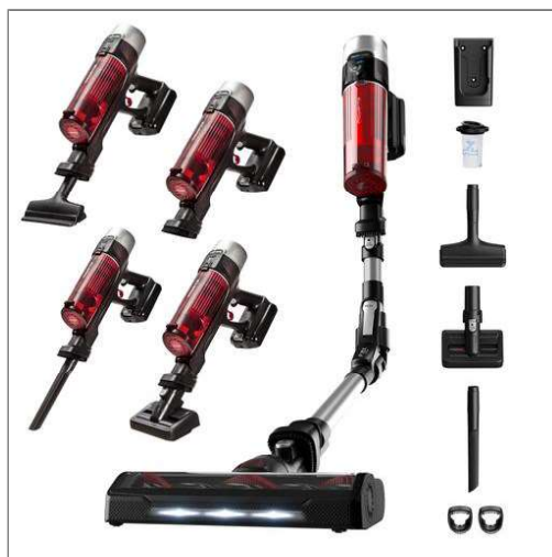
X-Force Flex 9.60, Aspiradora escoba sin cable, Animal Care Aspiradora escoba sin cable RH2077WO