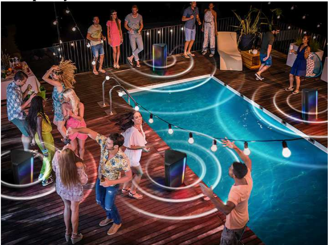
Bluetooth® Multi Connection